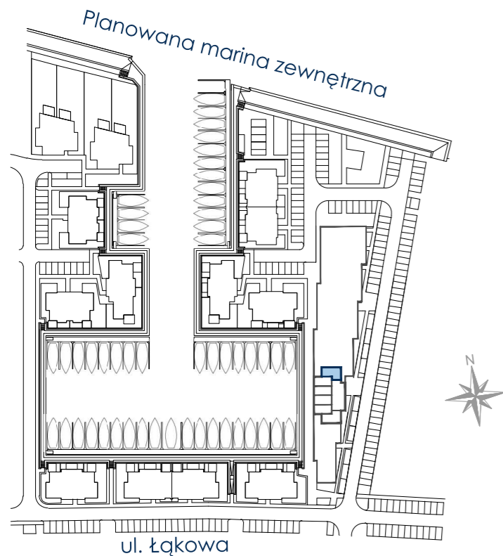
SCHEMAT ZAGOSPODAROWANIA TERENU

*Powierzchnia apartamentu zgodnie z normą PN-ISO 9836:1997; do powierzchni wliczono także elementy nadające się do demontażu - takie, jak ścianki działowe. Ze względu na trwające prace projektowe powierzchnie oraz lokalizacje przyborów sanitarnych mogą ulec zmianie. Wyposażenie przedstawione na karcie jest tylko w celach pokazania przykładowej aranżacji, nie stanowi zobowiązania umownego. ** Projektowana powierzchnia tarasów/ogródków/balkonów może ulec zmianie. Dopuszcza się lokalizowanie elementów infrastruktury technicznej na ich terenie.